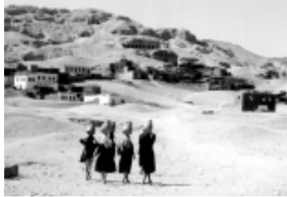
Vista del poblat de Gurna.

Actualment s'està fent una campanya molt activa dirigida als nadius de Gurna, que viuen en mig de les tombes privades, per traslladar-los fora de la zona. Fa gairebé 50 anys que s'està intentant que vagin a viure a un nou poble anomenat El Gurna el Guedida (La Nova Gurna), però tots els intents han fracassat. Ara les autoritats egípcies volen que s'instal·lin en un nou indret situat al nord de l'antiga Casa d'en Carter, construït per allotjar a la gent que es