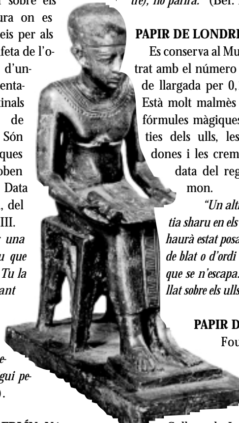
Estatueta d'Imhotep, deificat a la Baixa Època com a déu de la medicina. Època Saita (Museu del Louvre).

Fou descobert per Flinders Petrie el 1888 i actualment es conserva a l'University College de Londres. En realitat