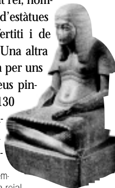
Estàtua del general Horemheb en l'actitud d'escriba reial.

El Metropolitan Museum de Nova York (MET), ha remodelat completament les sales dedicades a l'art de Tell el-Amarna (1353-1295 aC), que no s'havien "tocat" des de l'any 1978. L'art amarnià del MET està dividit en quatre àrees. Dues dedicades a les magnífiques escultures que s'hi exposen: el cap de quarsita vermella de la reina Tiyi, juntament amb un altre fragment de cap de jaspí groc, un cap de Tutankhamon, una estàtua sencera de Horemheb com a escriba, d'abans de ser coronat rei, nombrosos fragments d'estàtues d'Akhenaton, Nefertiti i de les princeses, etc. Una altra àrea està composta per uns 25 blocs amb relleus pintats ( talatats ) dels 130 que el Museu conserva, trobats a Hermòpolis i pro-