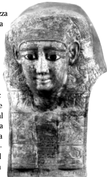
Màscara de mòmia. Museu Gregorià Egípcia.

Altres museus. D'altres museus romans tenen col·leccions o peces egípcies: el Museo Barracco, el Museu