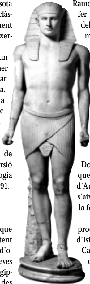
Estàtua d'Antínous. Museu Gregorià Egípcia.

cos de la Piazza Minerva, de la plaça del Pantheon, i dels que estan a la Villa Albani, a Florència i a Urbino.