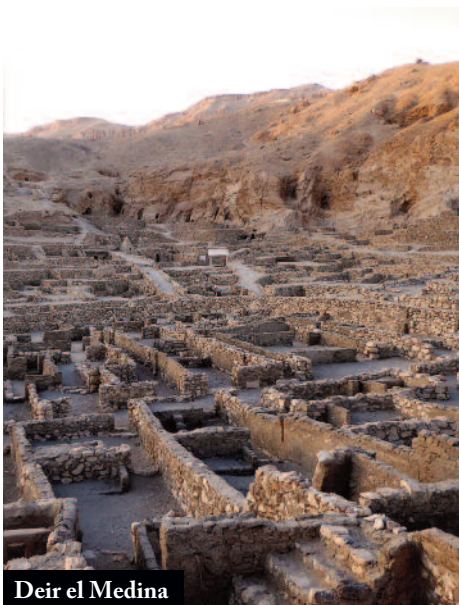
Deir el Medina

13è dia (13/03) LUXOR / EL CAIRE / BARCELONA: A l'hora prevista sortida en el vols d'Egyptair de tornada a Barcelona.