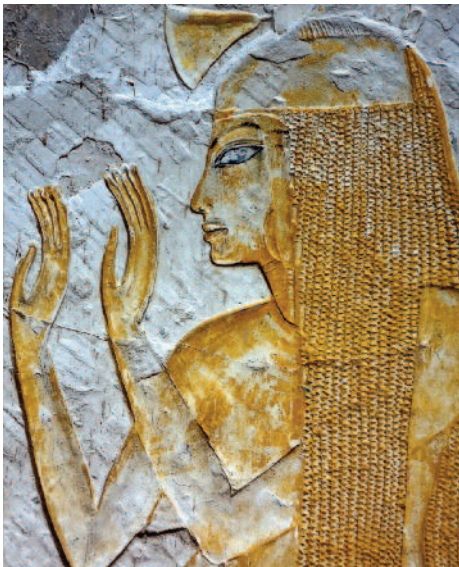
Tomba de Maya i Meryt (Saqqara)

tarda visita dels Temples de Medinet Habu (Tutmosis III/Hatshepsut, Ramesses III). Transbordador a Luxor. Temps lliure, sopar i allotjament.