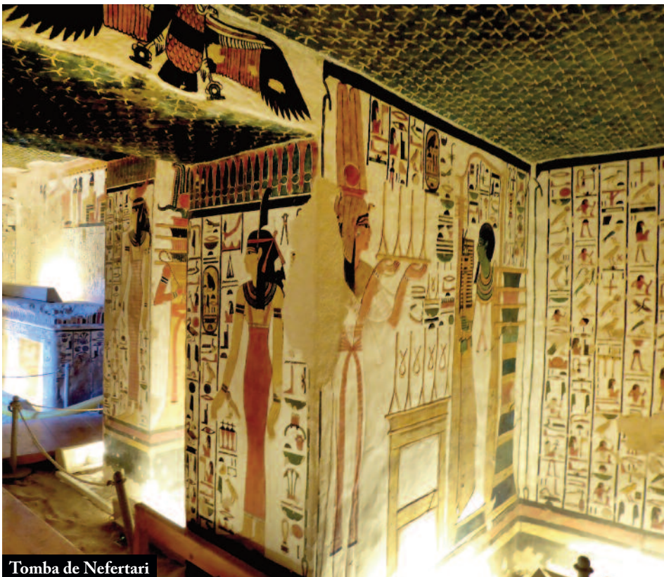
Tomba de Nefertari