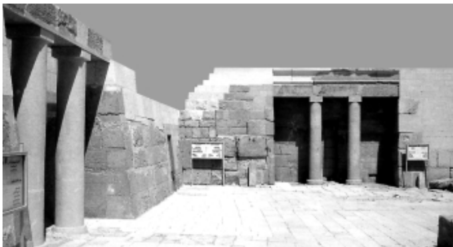
Grup de mastabes a l'oest de la piràmide de Quèops: Senedjemib Inti, Khnementi, Akhetmenu i Senedjemib Mehu.

Seguint amb la tasca de conservació dels monuments tebans, al Museu a l'aire lliure de Karnak, un equip francès està a punt de finalitzar la reconstrucció de la magnífica Capella per a la Barca realitzada per Hatxepsut (Capella Vermella), amb més de tres-cents blocs de quarsita vermella que varen ser trobats a l'interior dels fonaments del tercer piló de Karnak construït per Amenhotep III. Fins ara aquests blocs estaven disposats en el mateix museu, en varies fileres damunt d'un sòcol de ciment, un al costat de l'altre. Els visitants al museu no tenien una visió de com era el monument en conjunt, però en contrapartida, podien contemplar (i fotografiar) els magnífics relleus mentre passejaven per entre les fileres d'aquests blocs fantàsticament ben conservats. Una vegada la Capella Vermella estigui completament reconstruïda serà