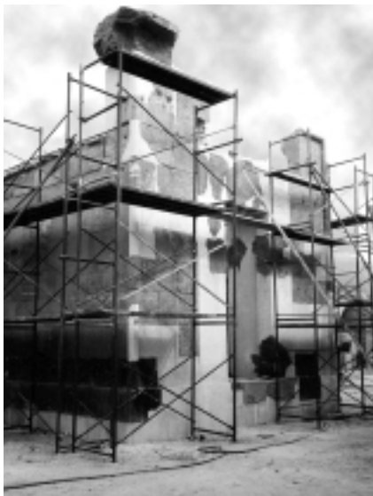
Obres de reconstrucció de la Capella Vermella de Hatxepsut, al Museu a l'aire lliure de Karnak.

impossible, atesa la seva alçada, poder contemplar de prop aquests bells relleus tan finament esculpits.