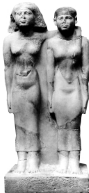
Grup estatuari representant a la reina Hetep-heres II amb la seva filla Mersyankh III (Museu Fine Arts de Boston. MFA 30.1456).

De la inscripció que ha donat peu a escriure aquestes línies, s'ha de dir que actualment queda dissimulada per la gran porta metàl·lica que protegeix i dóna accés a la tomba. La inscripció es troba esculpida verticalment a banda i banda dels costats exteriors de la porta d'entrada. Al costat nord (a la dreta), amb els signes mirant cap a l'esquerra hi diu: s3t nswt Mr.sy-ꜥnh h3t-sp I 3bd tpy smw sw 21 htp k3.s hpt.s r wꜥbt , "la filla reial Mersyankh, any 1, mes 1 de Xemu, dia 21. El repòs del seu ka i el seu trasllat a la casa de purificació". Segons aquesta inscripció, s'entén que Mersyankh va morir el dia 21 del primer mes de l'estació d'estiu del primer any, probablement del regnat de Micerí i que va ser transportada a la casa de purificació per a ser embalsamada.