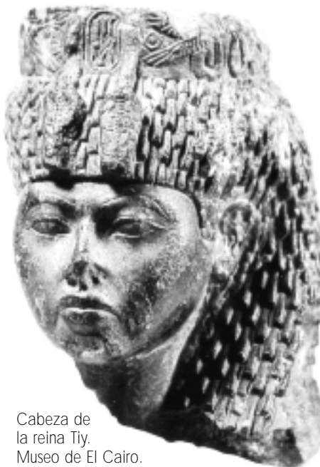
Cabeza de la reina Tiy. Museo de El Cairo.

encuentra solamente a partir de Tutmosis III y exclusivamente en el gineceo de Mer-wer, situado en Medinet el-Gurab (a la entrada de el-Fayum). Según Kemp, este gineceo era un palacio con todo su sistema organizativo y con recursos propios de todo tipo, considerándose una residencia veraniego de las reinas de este período y muy diferente de los harenes anexos de los distintos palacios reales.