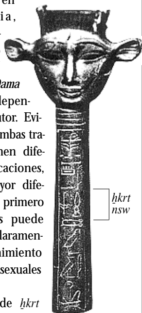
Mango hallado en la tumba KV46. Museo Egipcio de El Cairo.

El título de hkrt nsw arranca de la IV Dinastía, pero en la XVIII se