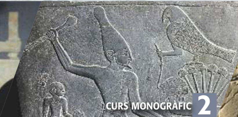
CURS MONOGRÀFIC 2