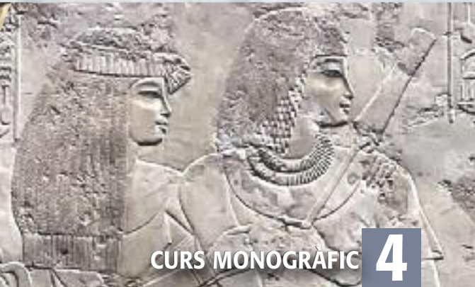
CURS MONOGRÀFIC 4